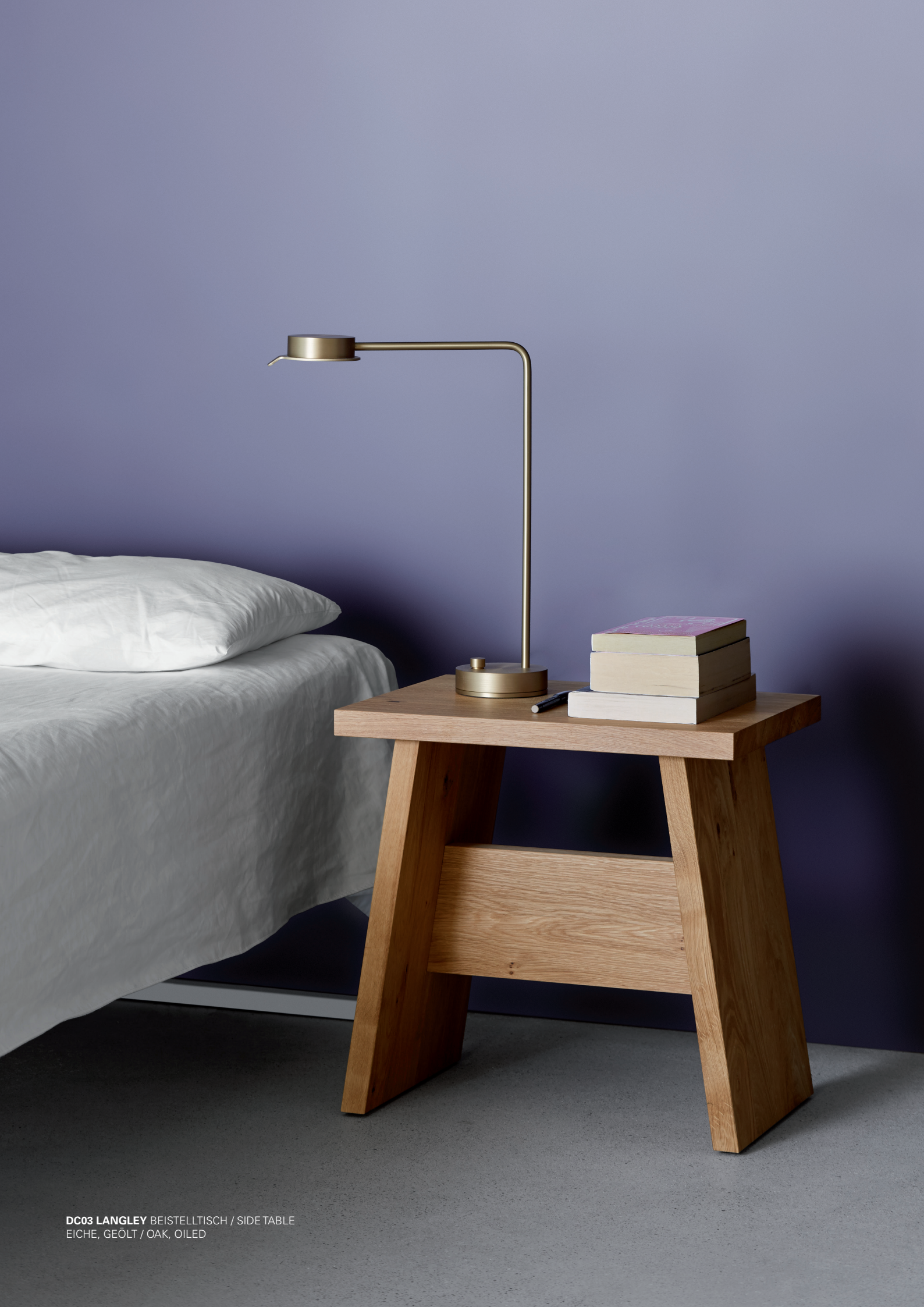
DC03 LANGLEY BEISTELLTISCH / SIDE TABLE EICHE, GEÖLT / OAK, OILED