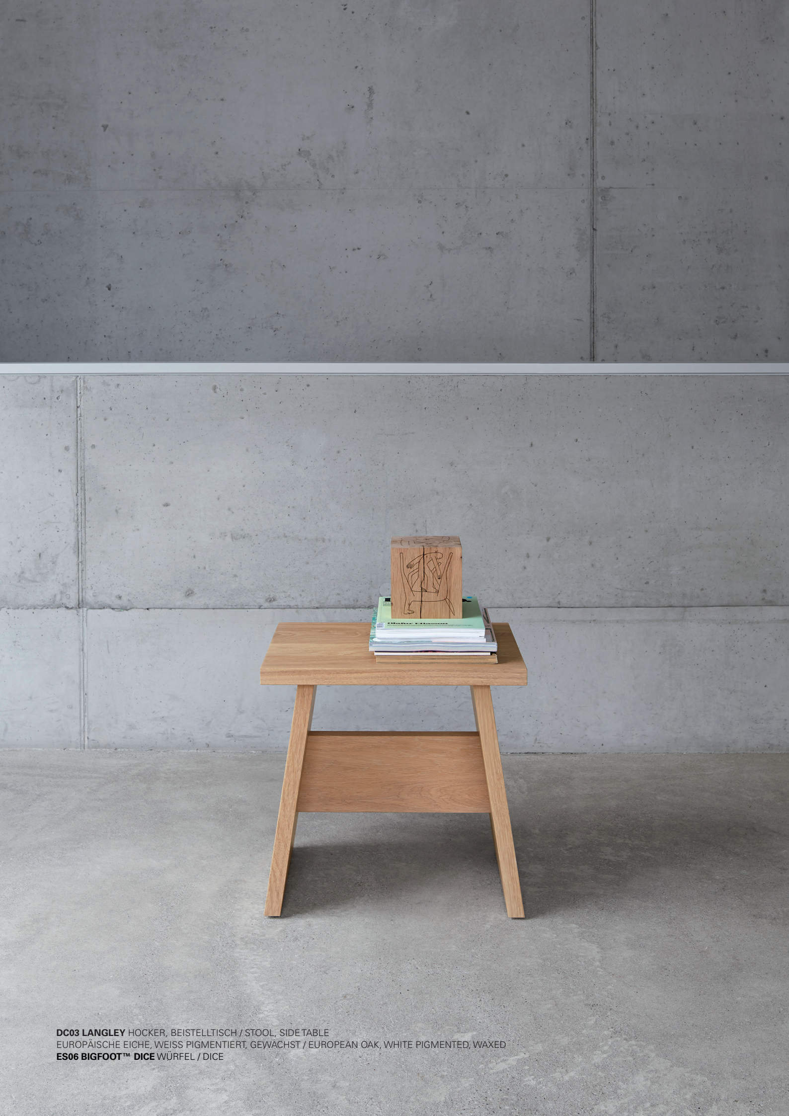
DC03 LANGLEY HOCKER, BEISTELLTISCH / STOOL, SIDE TABLE EUROPÄISCHE EICHE, WEISS PIGMENTIERT, GEWÄCHST / EUROPEAN OAK, WHITE PIGMENTED, WAXED ES06 BIGFOOT™ DICE WÜRFEL / DICE