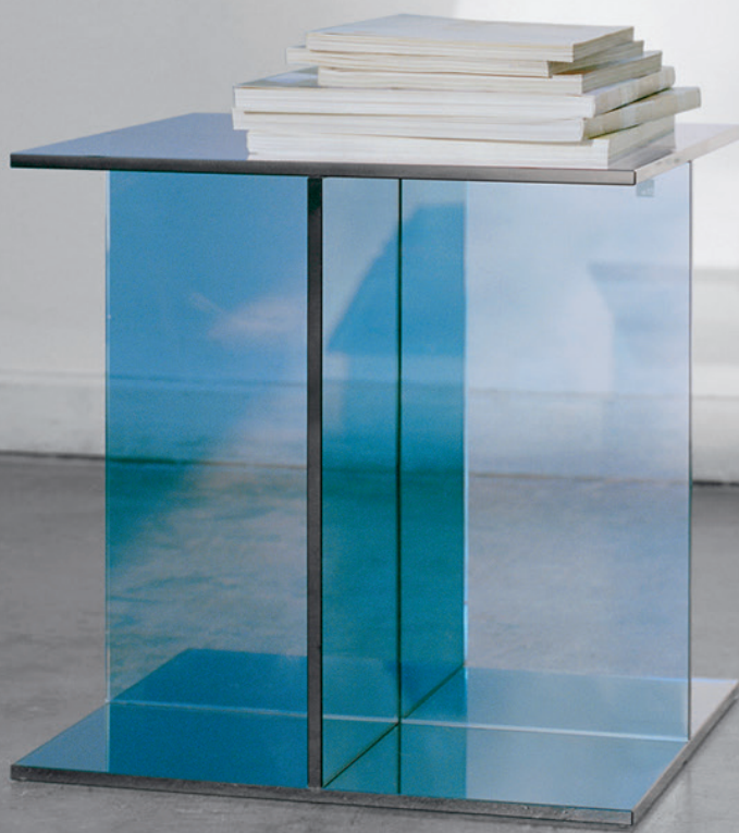
CT08 VIER BEISTELLTISCH / SIDE TABLE GLAS, DUNKELBLAU / GLASS, DARK BLUE CH04 HOUDINI STUHL / SIDE CHAIR