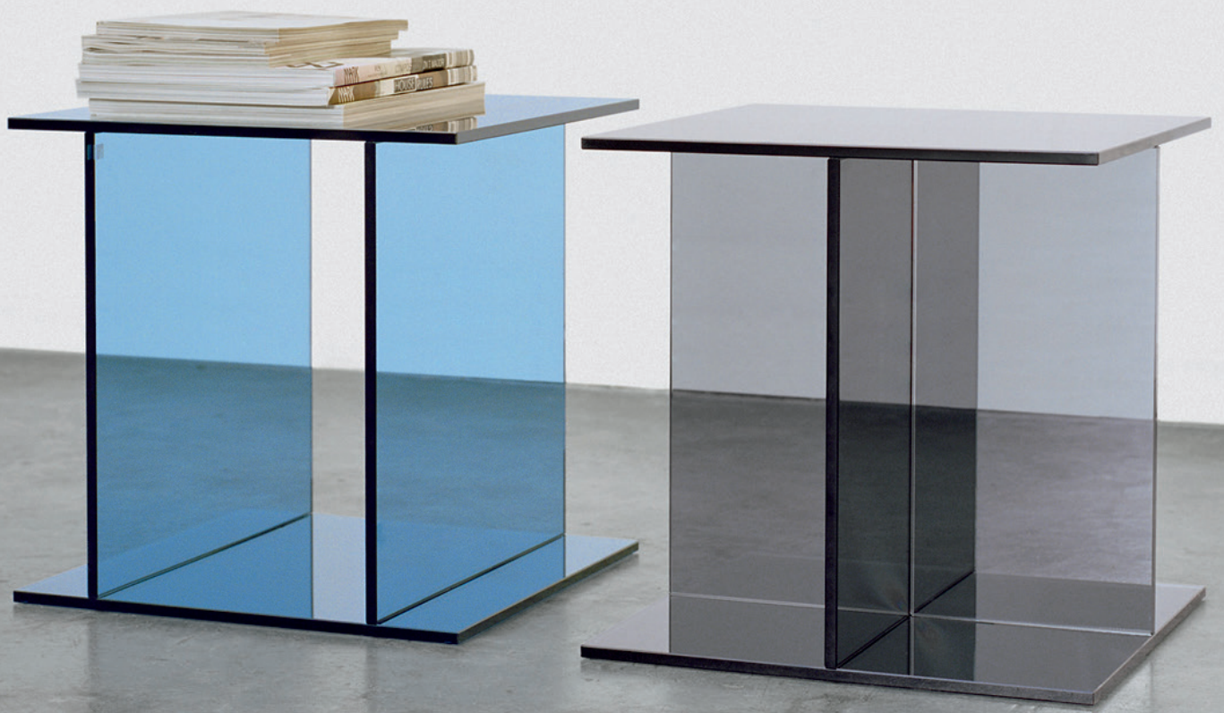
CT07 DREI BEISTELLTISCH / SIDE TABLE GLAS, DUNKELBLAU / GLASS, DARK BLUE CT08 VIER BEISTELLTISCH / SIDE TABLE