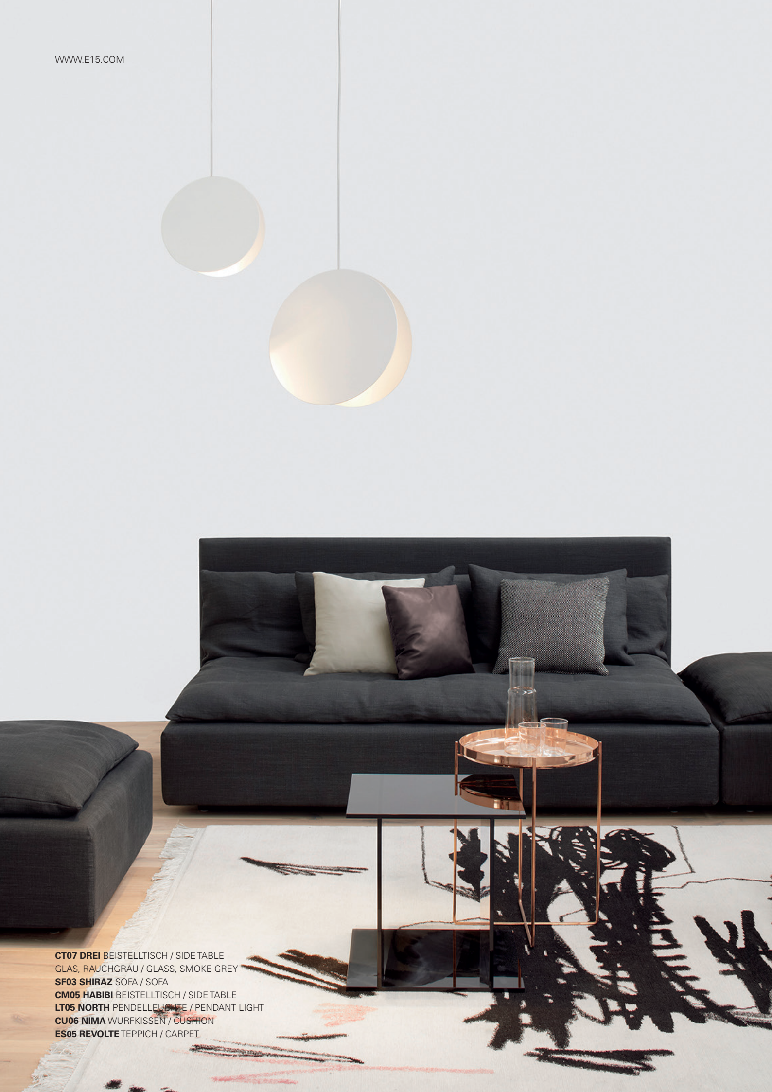
CT07 DREI BEISTELLTISCH / SIDE TABLE GLAS, RAUCHGRAU / GLASS, SMOKE GREY SF03 SHIRAZ SOFA / SOFA CM05 HABIBI BEISTELLTISCH / SIDE TABLE LT05 NORTH PENDELLEUCHE / PENDANT LIGHT CU06 NIMA WURFKISSEN / CUSHION ES05 REVOLTE TEPPICH / CARPET