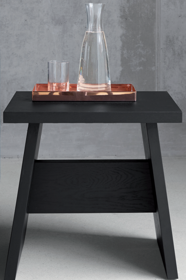
CM04 ITO TABLETT / TRAY KUPFER, POLIERT / COPPER, POLISHED DC03 LANGLEY HOCKER, BEISTELLTISCH / STOOL, SIDE TABLE