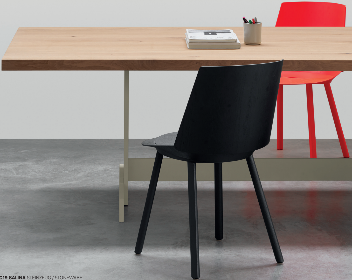
AC19 SALINA STEINZEUG / STONEWARE STEINZEUG / STONEWARE TA23 KAZIMIR TISCH / TABLE CH04 HOUDINI STUHL / SIDE CHAIR