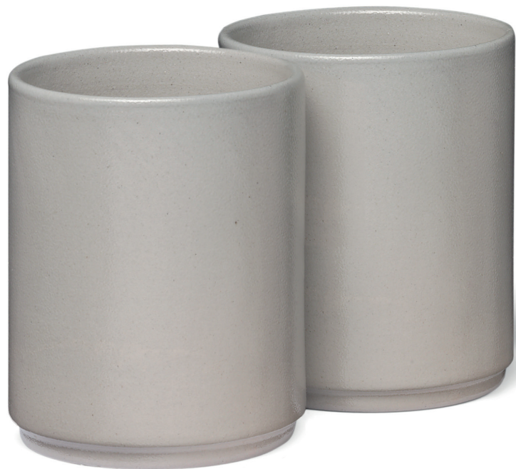
AC19 SALINA STEINZEUG / STONEWARE STEINZEUG / STONEWARE