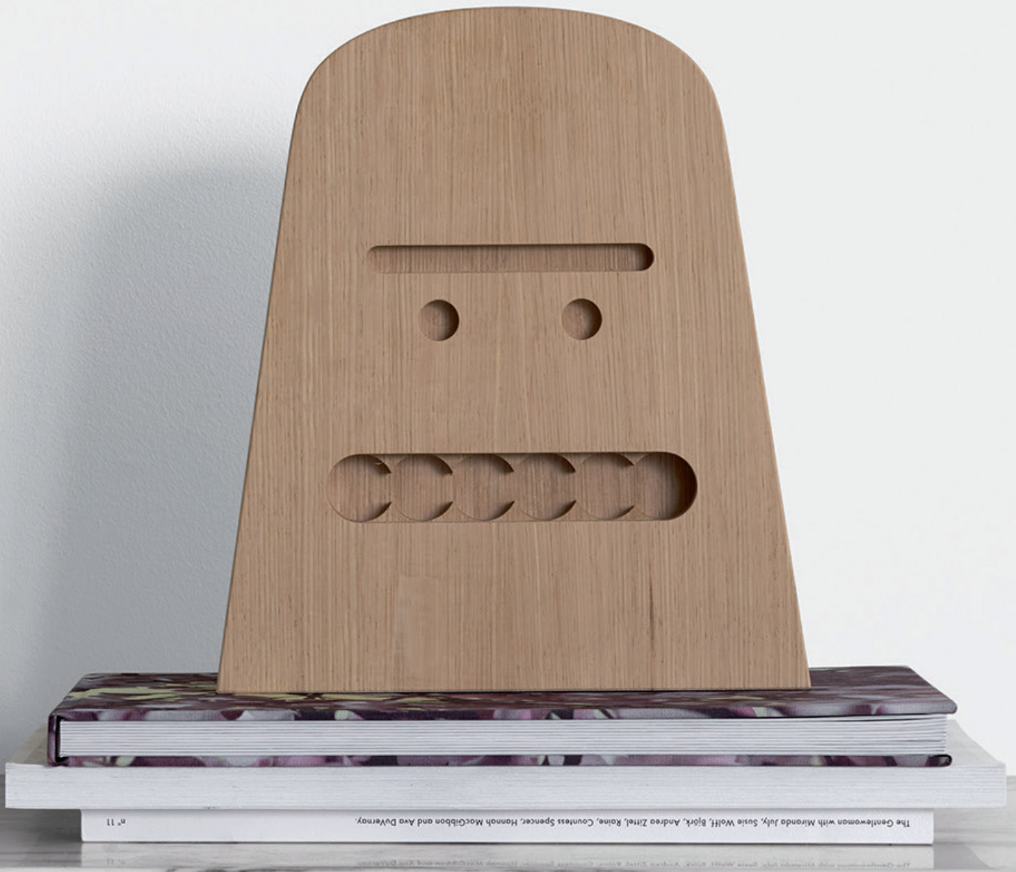
AC17 BIG B OBJEKT / OBJECT EICHE, UNBEHANDELT / OAK, UNTREATED