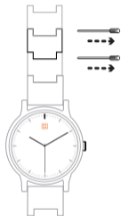
Abb. 1: Entfernen der Stifte