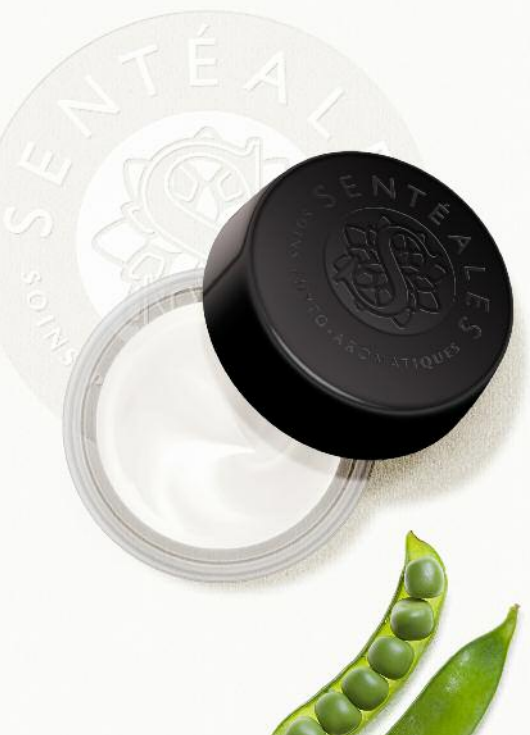
Réf. 140 - Pot verre - Glass jar - 50ml