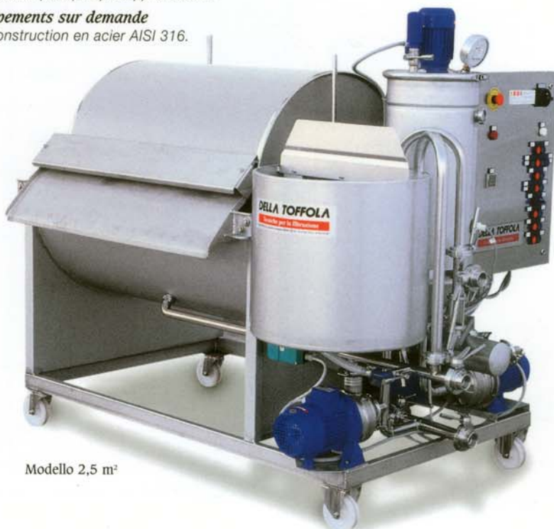
Modello 2,5 m 2

Una serie completa de superficies filtrantes -de 2,5 a 80 metros cuadrados- permite además satisfacer de la mejor forma las diferentes exigencias de prestaciones y rendimientos.