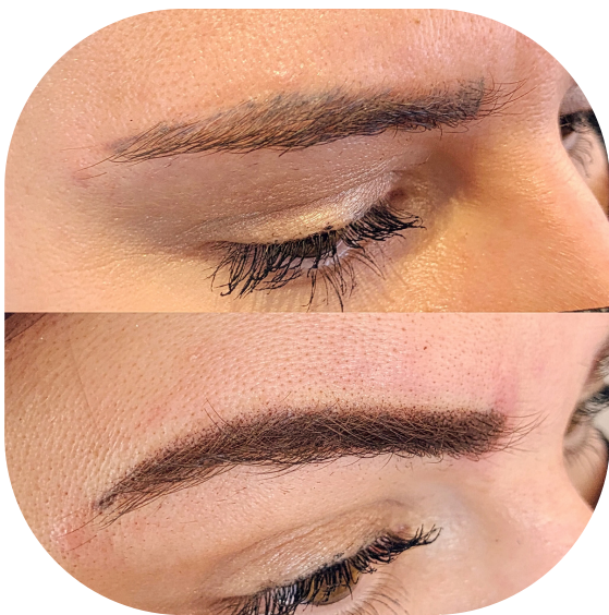
Correction de couleur