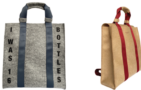
REGENESI ReFlag Zaino

REGENESI mod. RE-FLAG ZAINO: Lo zaino Re-Flag, accessorio eco-sostenibile ideale nella daily routine, deriva da un tessuto che nasce dal riciclo e dalla rigenerazione di bottiglie di plastica. Perfetto per le giornate più dinamiche. Capiente, comodo da indossare e dall'estetica unica e d'impatto. Disponibile per la prima volta anche in beige con nastro burgundi a contrasto.