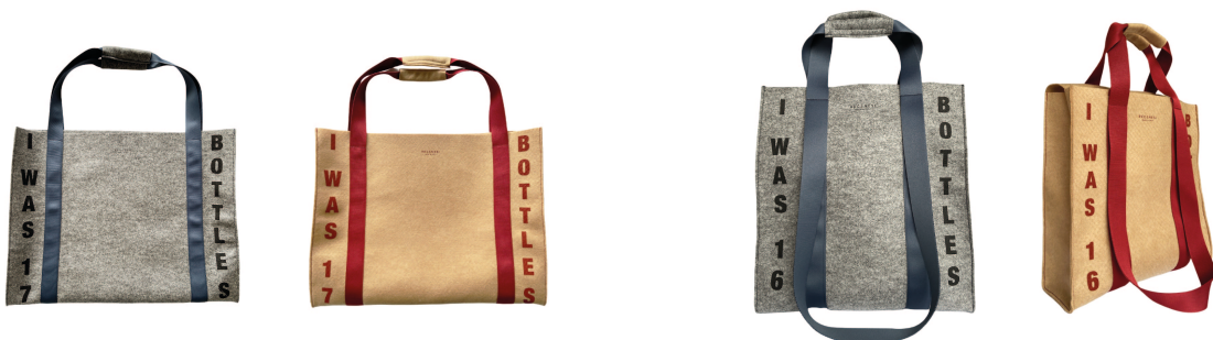
REGENESI ReFlag Maxi

REGENESI mod. RE-FLAG DUFFLE: Stile metropolitano e contemporaneo per la borsa realizzata con un tessuto che nasce dal riciclo e dalla rigenerazione di bottiglie di plastica. Il borsoni, perfetto per il tempo libero, il viaggio e lo sport, ha un carattere eco-chic dai forti contrasti di colore.