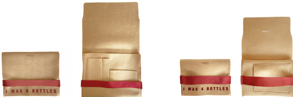
REGENESI ReFlag Clutch

REGENESI mod. RE-FLAG ZAINO: Lo zaino Re-Flag, accessorio eco-sostenibile ideale nella daily routine, deriva da un tessuto che nasce dal riciclo e dalla rigenerazione di bottiglie di plastica. Perfetto per le giornate più dinamiche. Capiente, comodo da indossare e dall'estetica unica e d'impatto. Disponibile per la prima volta anche in beige con nastro burgundi a contrasto.