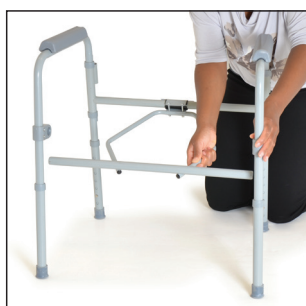
Insérer la barre transversale avant dans les supports avant (situés sur les pattes avant du châssis de la chaise d'aisance). S'assurer que les deux goupilles métalliques S'ENCLENCHENT PARFAITEMENT dans les trous.