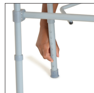
Ajuster les 4 pattes à la hauteur désirée en les faisant glisser VERS LE HAUT ou VERS LE BAS. Aligner les goupilles métalliques en vous assurant qu'elles s'enclenchent parfaitement dans les trous. Veiller à ce que les 4 pattes soient réglées à la même hauteur.