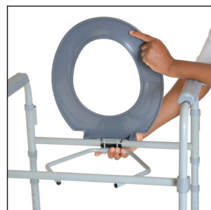
Emboîter le siège et le couvercle de toilettes à la barre de soutien arrière.