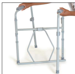
Déplier le châssis de la chaise d'aisance.