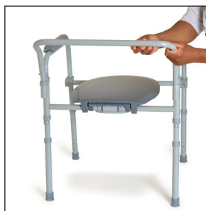
Fixer la barre en U en insérant les deux extrémités dans le châssis arrière de la chaise d'aisance. S'assurer que les goupilles métalliques S'ENCLENCHENT PARFAITEMENT dans les trous correspondants.