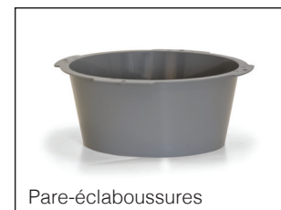
Utiliser la chaise d'aisance avec le seau au chevet d'un patient et le pare-éclaboussures avec la chaise d'aisance au-dessus de toilettes.