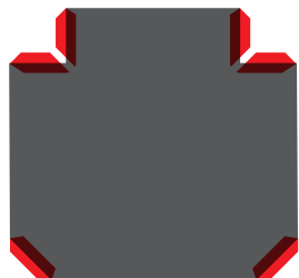
Slitta con sei guide a V Slide with six V enlarged shape guides

(*) Measured between table and slide with closed die at max. stroke