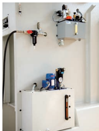
Centrale di lubrificazione Lubricating station