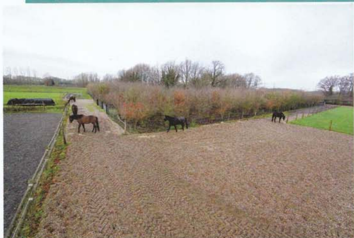
Een paddockparadijs heeft een wandelgang rondom de weide met verschillende 'haltes' voor eten, drinken, een schuilstal of een zandbak.