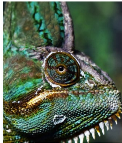
Mehr Einzelheiten - Längeres Malen