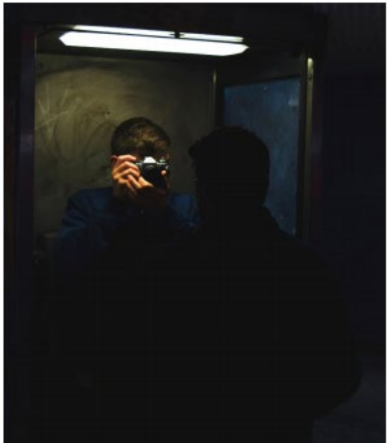
Zu dunkles Bild