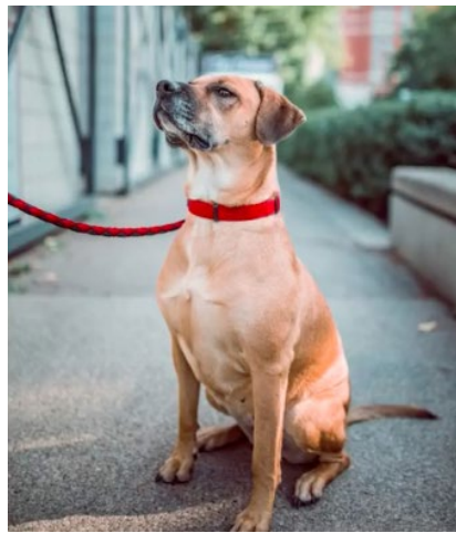
Klarer Hintergrund - Leichter zu malen