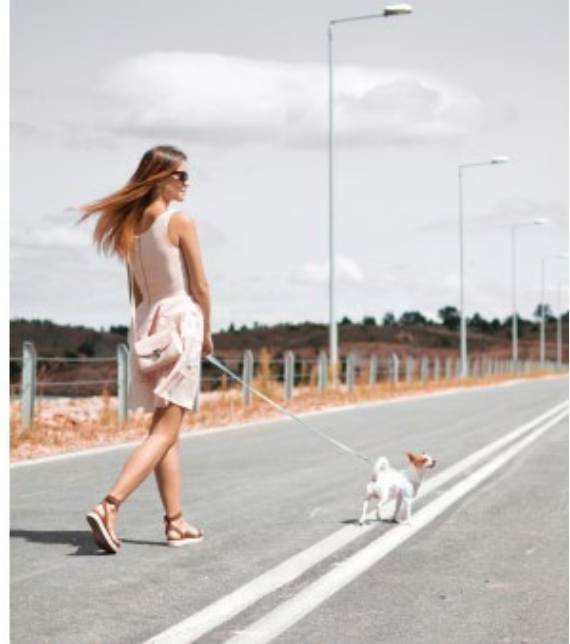
Zu weit entfernt