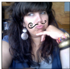
Cocotte en papier