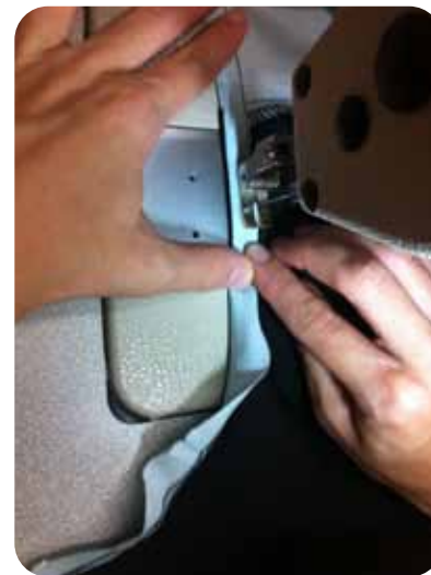
7. לקפל את הקצה השני של הסרט, זה שעדיין לא תפור, ולתפור על הקיפול בתפר קצה.