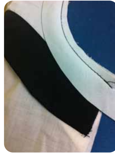
2. להניח את סרט האלכסון ימין על ימין, קצה לקצה ולתפור במרחק רגל מכונה, תוך כדי יש לשחרר את הסרט ולא למתוח.