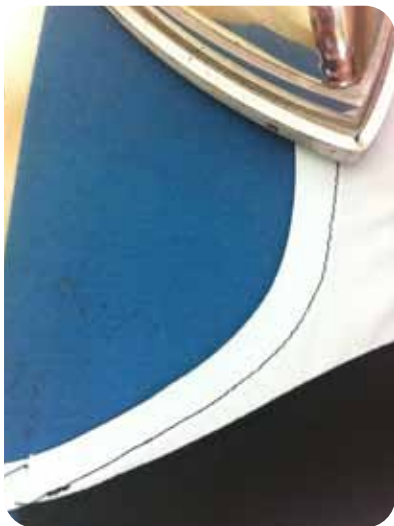
8. לגהץ גיהוץ סופי וזה הכל!