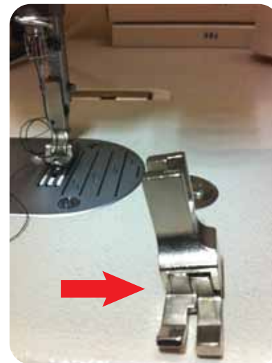
6. * להחליף את רגל מכונת התפירה ל"רגל קצה" שנראית כך: